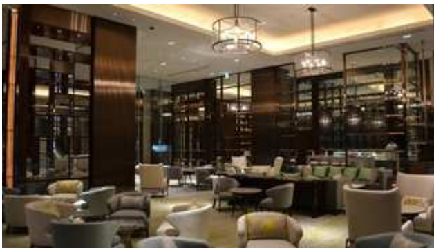
パレスホテル東京