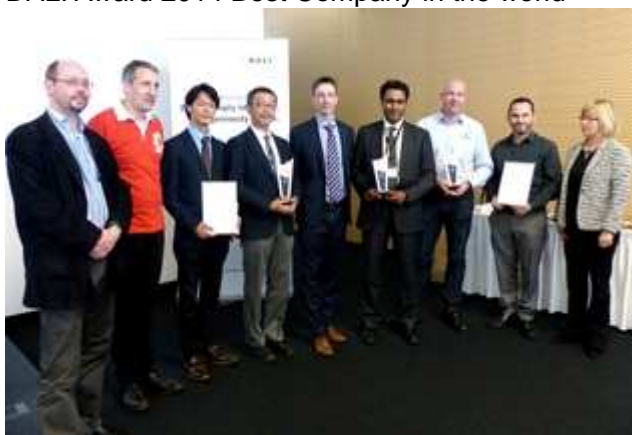
DALI Award 2014 Best Company in the world