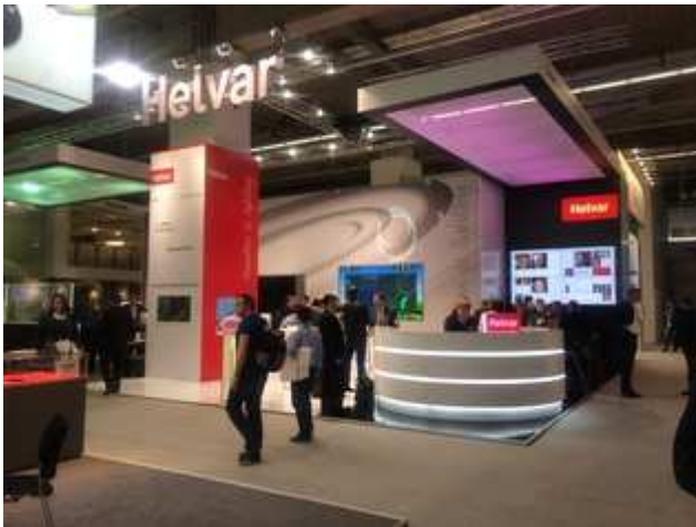
Light+Building Helvar ブース