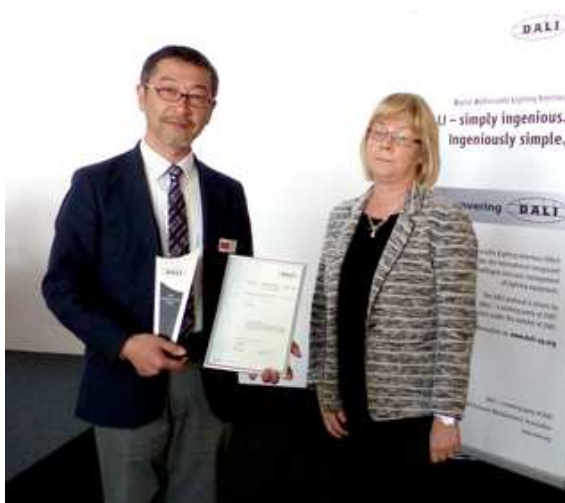
DALI Award 2014 Best Company in the world