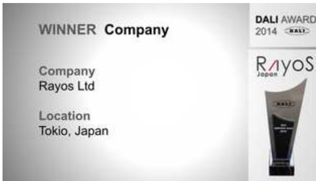
DALI Award Winner