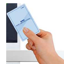
主照明のオンオフ操作