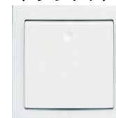
バスルームの照明をオンオフ